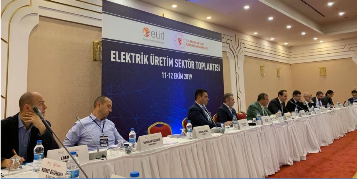
Elektrik Üretim Sektör Toplantısı 11-12 Ekim'de yapıldı