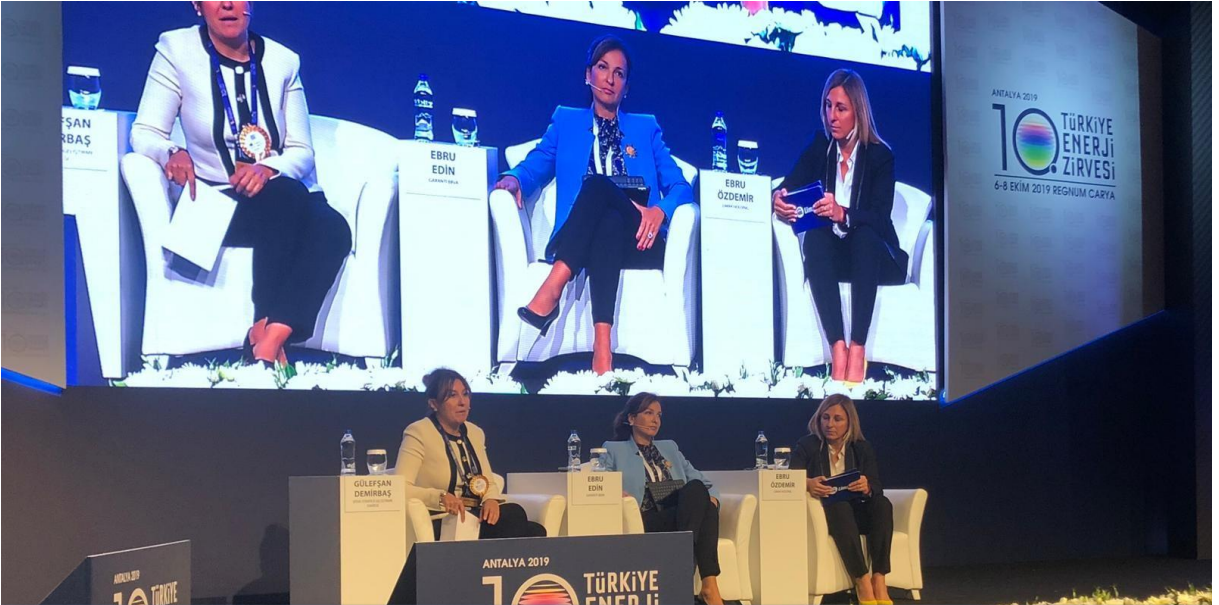
Enerji sektörünün kadınları Türkiye Enerji Zirvesi'nde buluştu