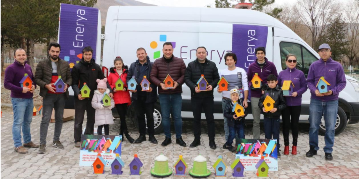
Üyelerimizden Enerya'dan Erzincan'da "Kuşları Yuvalandırma" projesi