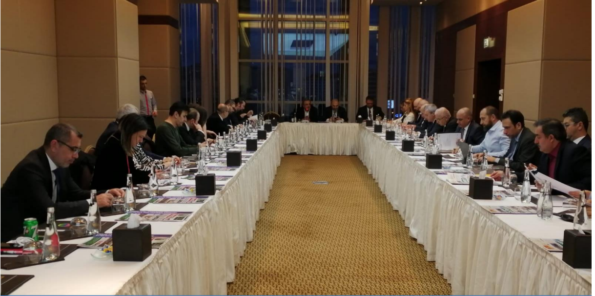
11. Türkiye Enerji Zirvesi 1. Danışma Kurulu toplandı