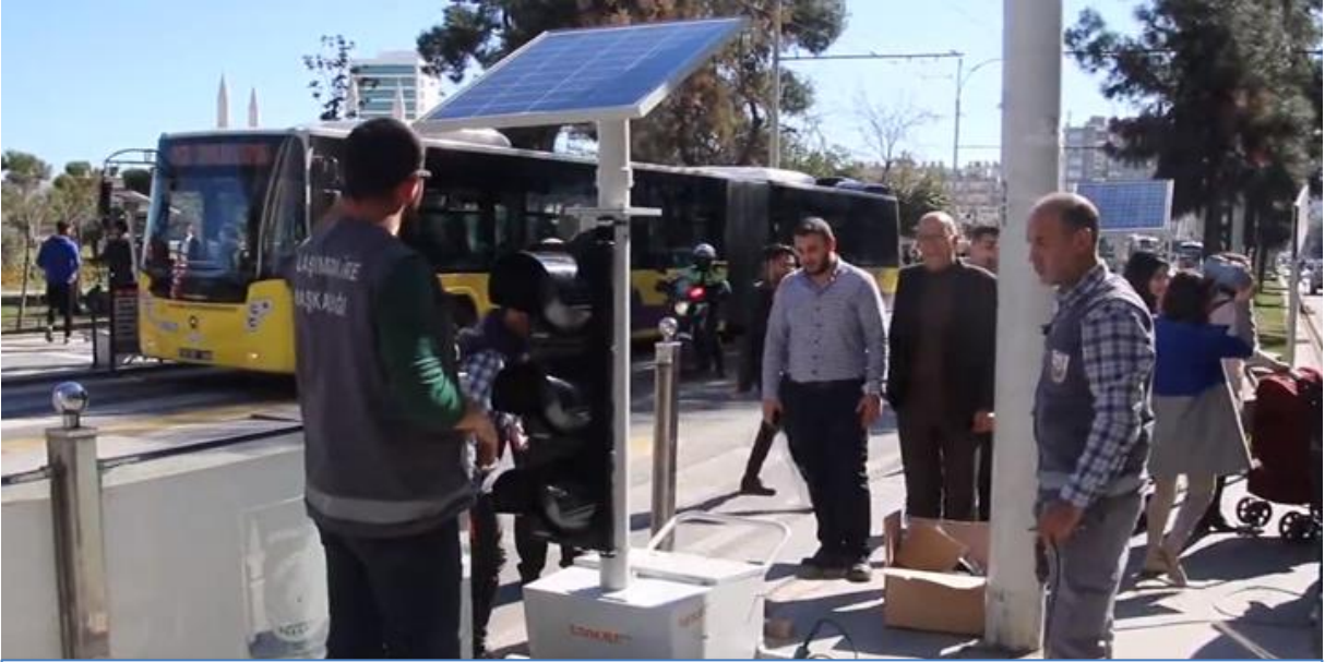
Şanlıurfa Büyükşehir Belediyesi Güneş Enerjili Mobil Sinyalizasyon Kurdu