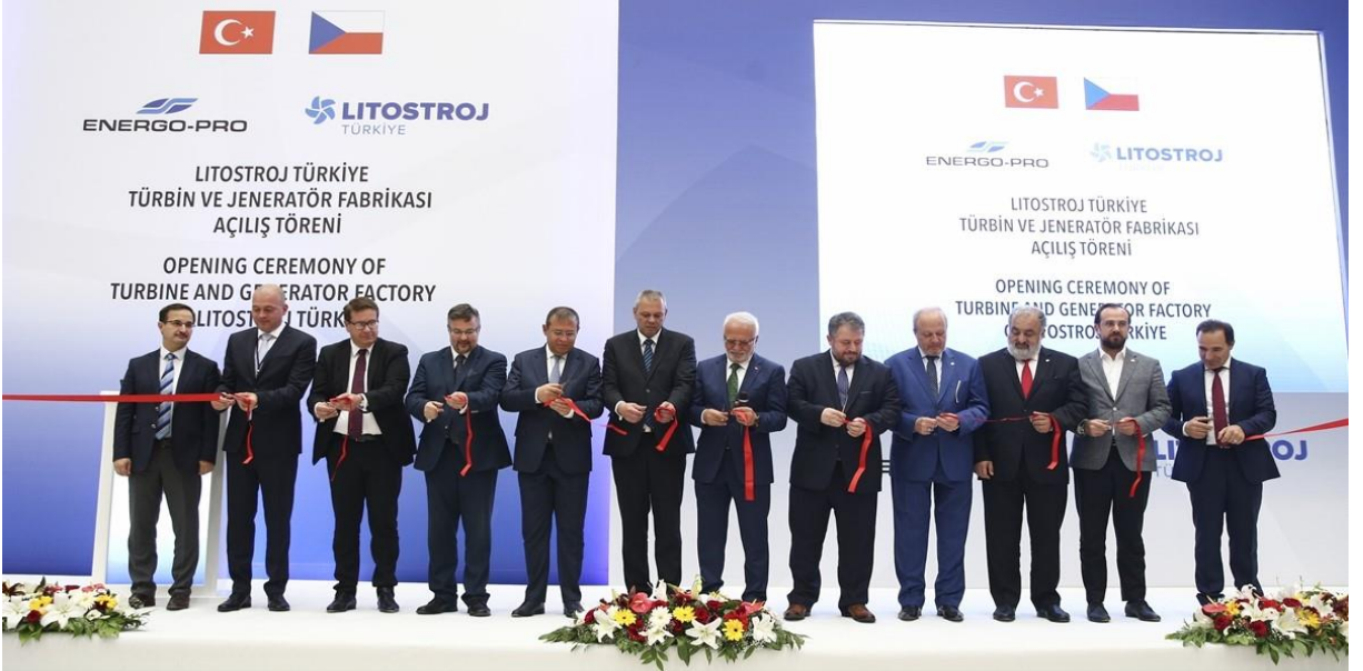
Energo-Pro Türkiye'de türbin fabrikası açtı