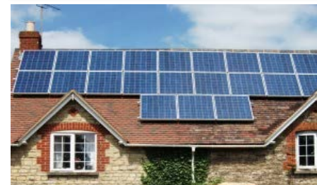
2030'a kadar 72 milyon ev daha elektriğini güneşten sağlayacak.