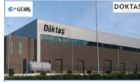
GÜRİŞ, TÜRKİYE'NİN EN BÜYÜK AVRUPANIN, 5. BÜYÜK DÖKÜM KURULUŞU DÖKTAŞ'I BÜNYESİNE KATTI.