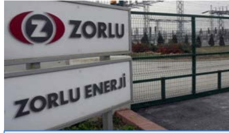
Zorlu Enerji'nin kredi notu yükseldi