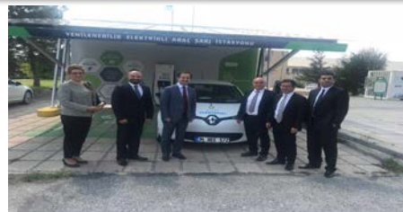
GÜYAD, ETKB Bakan Danışmanı Oğuz Can Bey'i ziyaret etti.