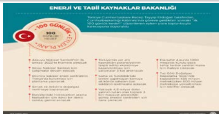
100 günlük eylem planı: Enerji ve Tabii Kaynaklar Bakanlığı