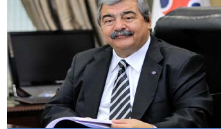
SANKO'nun 4 şirketi ikinci 500 listesinde.