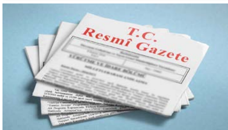
Enerji ve Tabii Kaynaklar Bakanlığı Bakan Yardımcıları belli oldu.