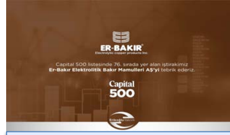
Er-Bakir Elektrolitik Bakır Mamulleri AŞ Capital 500 listesinde 76. sırada.