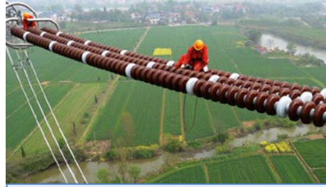
Energija'ya İngiltere'den 'en iyi müşteri hizmetleri' ödülü.