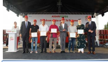
Kibar Holding Yönetim Kurulu Başkanı Ali Kibar'dan 20'nci yıl sözü