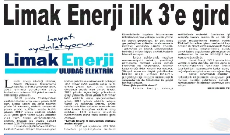
Limak Enerji Uludağ Elektrik, 2017 yılında perakende satış faaliyetinde bulunan şirketler arasında 3. sraya yükseldi.