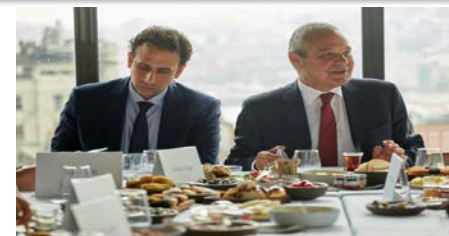
SHURA: Elektrik şebekemiz 60 GW rüzgar ve güneş enerjisini kaldırabilir