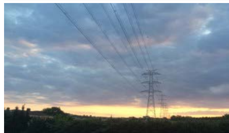
Türkiye'de yılın ilk altı ayındaki elektrik üretim miktarı yüzde 2,5'lik arttı.