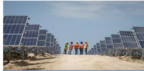
Akfen Holding tarafından 55 milyon dolarlık GES yatırımı