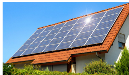
İşte çatı üstü mikro GES'ler için tip proje.